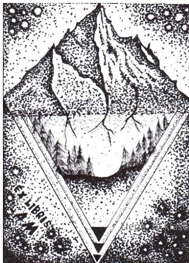
Liepa, IV klasė